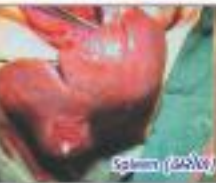
Spleen (બરોળ) Abscess