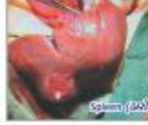
Spleen (સપ્લીન) / Abscess